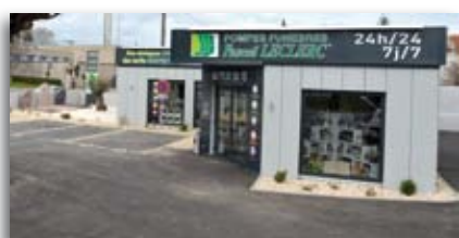
Façade du nouveau complexe funéraire.