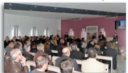
L'assemblée lors du discours d'inauguration